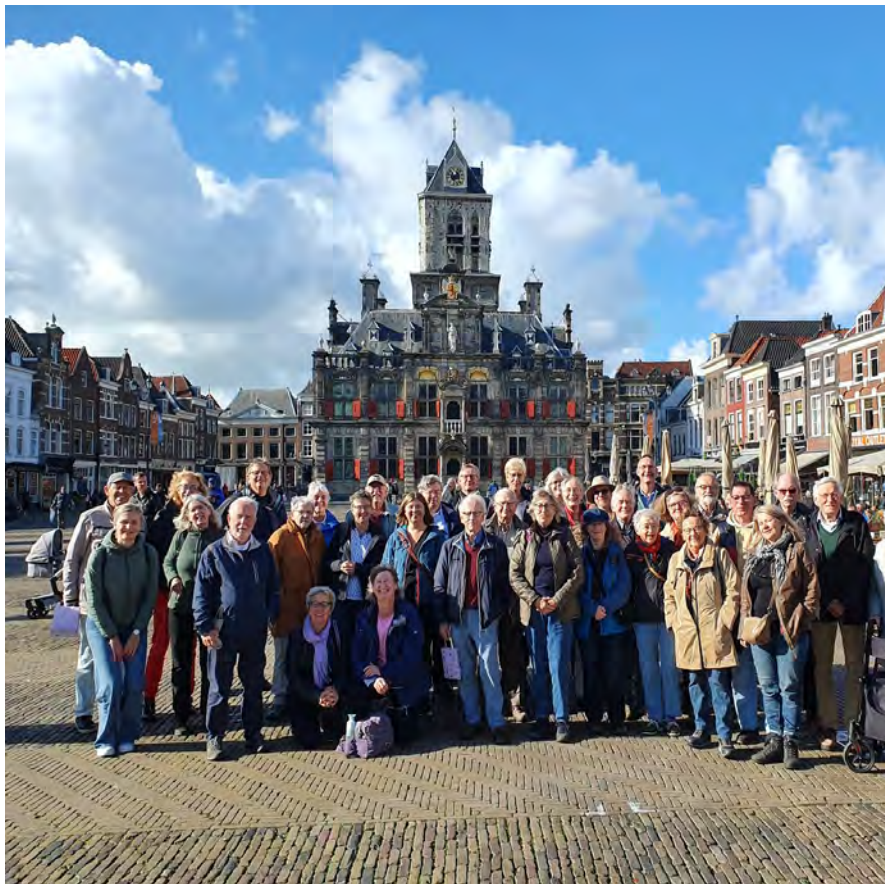
Excursie voor de vrijwilligers, Grote Markt van Delft 2022