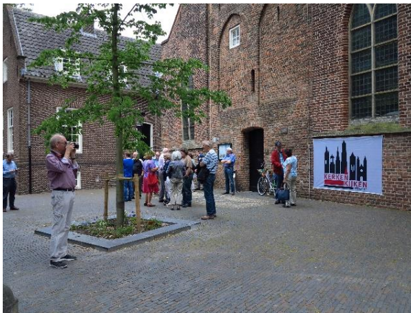
Bezoekers bij de Geertekerk

* In 2017 was de St. Augustinuskerk gesloten wegens verbouwing, en zijn er geen KKV gidsen beschikbaar geweest bij de Willibrorduskerk.