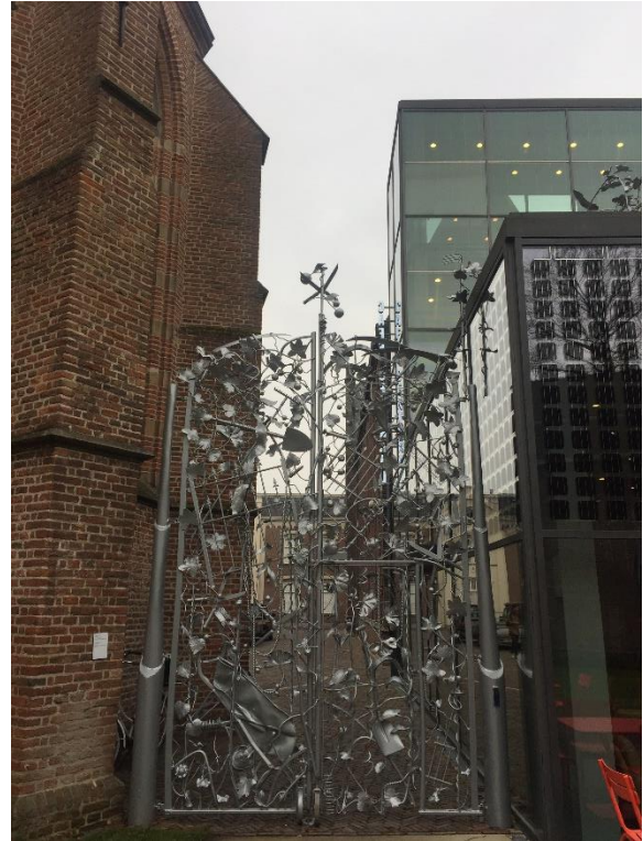
Buitenzijde Centraal Museum

Na afloop van haar verhaal nam ze ons mee naar het deel van het museum dat normaal gesproken niet toegankelijk is voor bezoekers: de oude, originele wenteltrap uit de tijd dat het museum een weeshuis was. Daarna wees ze ons in de tuin aan de buitenkant van het gebouw hoe we de verschillende aanbouwsels en renovaties konden herkennen