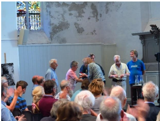
Overhandiging oorkonde aan zes gidsen

te metselen en de kerk werd enige tijd gebruikt als kinderkerk. In 1930 werd de kerk ontruimd en in 1939 waren er sloopplannen om plaats te maken voor een bejaardentehuis. In 1941 werd toestemming gegeven voor de sloop, maar dit werd enkele maanden later alweer ingetrokken. De Nationaal-Socialistische Beweging (NSB) wilde het gebouw namelijk gebruiken. De plannen van de NSB gingen echter niet door omdat de Hervormde Gemeente weigerde het gebouw aan de NSB te verkopen. De NSB zorgde er vervolgens voor dat de overheid de kerk onteigende, maar de bevrijding maakte een eind aan deze ontwikkeling, waarna de kerk werd teruggegeven aan de Hervormde Gemeente. Inmiddels was het dak wel verwijderd wegens instortingsgevaar. Uiteindelijk werd de kerk verkocht aan de Remonstranten, waarna herbouw plaatsvond.