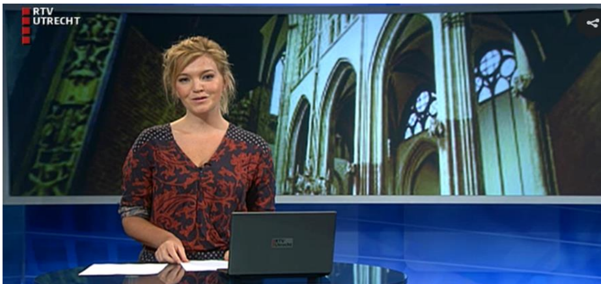
KKU in uitzending RTV Utrecht

Daarnaast kwam KKU met de Nicolaïkerk in een uitzending van RTV Utrecht om te vertellen over de het nieuwe KKU-seizoen.