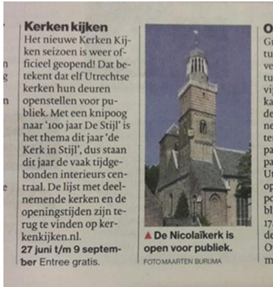
Artikel: AD/UN 29 juni 2017

In diverse lokale media werd aandacht besteed aan de opening van het nieuwe Kerken Kijken seizoen.