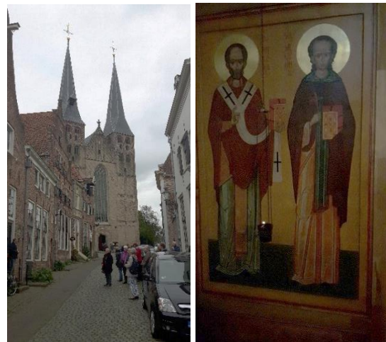
Foto links: De Bergkerk. Rechts: de Heilige Lebuïnus zoals afgebeeld op de Iconostase van de Petrus- en Paulus Kerk.

Een zeer verrassend begin van de stadexcursie vormde het bezoek aan de Orthodoxe Petrus- en Paulus Kerk, die deel uitmaakt van het Patriarchaal Exarchaat voor de Russisch-Orthodoxe parochies en kloosters in West-Europa. Hier werden wij allerhartelijkst ontvangen en was gelegenheid vragen te stellen en de rijk gedecoreerde iconostase te bewonderen.