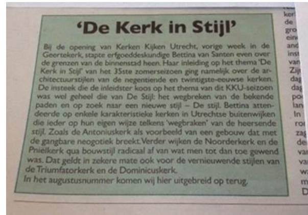
Artikel: Kerk in de stad 29 juni 2017

Kerken Kijken Utrecht zat in de radio-uitzending Aan tafel van RTV Utrecht om te vertellen over het veelzijdige KKU-programma en een oproep te doen voor nieuwe gidsen.